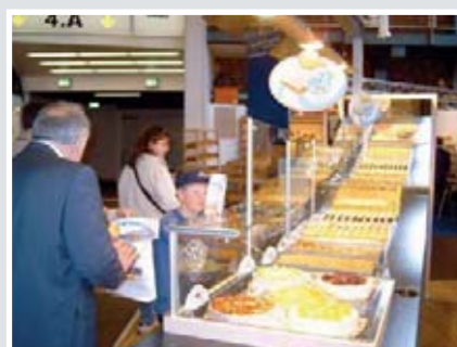
Die „Welle“ im Einsatz