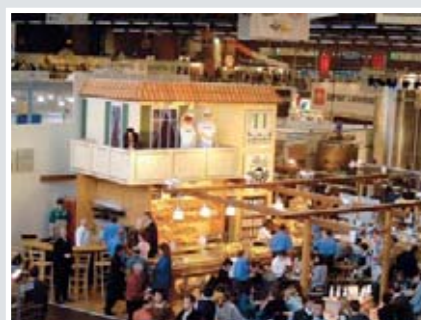
Messestand voller Leben