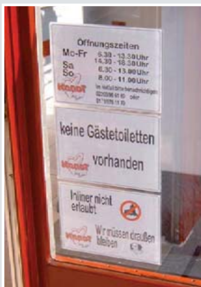
So einfach könnte es sein...

Während in Niedersachsen, Berlin, Brandenburg oder Hessen sich die Situation unbürokratisch normalisiert hat (10 Sitzplätze in Bäckereien – auch ohne Kundentoiletten) gibt es in NRW offenbar erheblichen Handlungsbedarf. Angesichts der