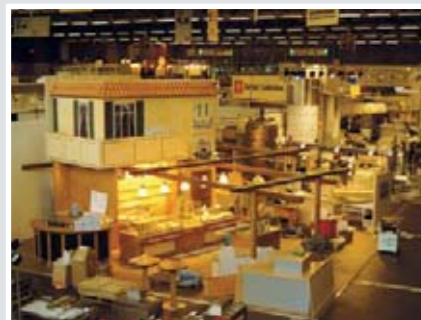
Countdown – während der Aufbauzeit