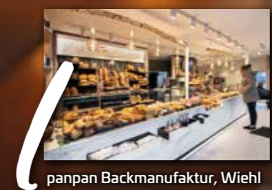
1 panpan Backmanufaktur, Wiehl

Walterscheid - Geschäftseinrichtungen GmbH · Ohlenhohnstraße 40 - 42 · D-53819 Neunkirchen Tel.: 0 22 47 / 91 88 -0 · Fax: 0 22 47 / 91 88 15 www.walterscheid.info · info@walterscheid.info · @walterscheidprojektschmiede