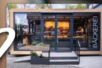
2 TINY STORE double 2